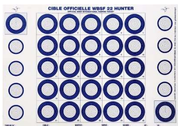
Cible Match format A3 (29,7 X 42)